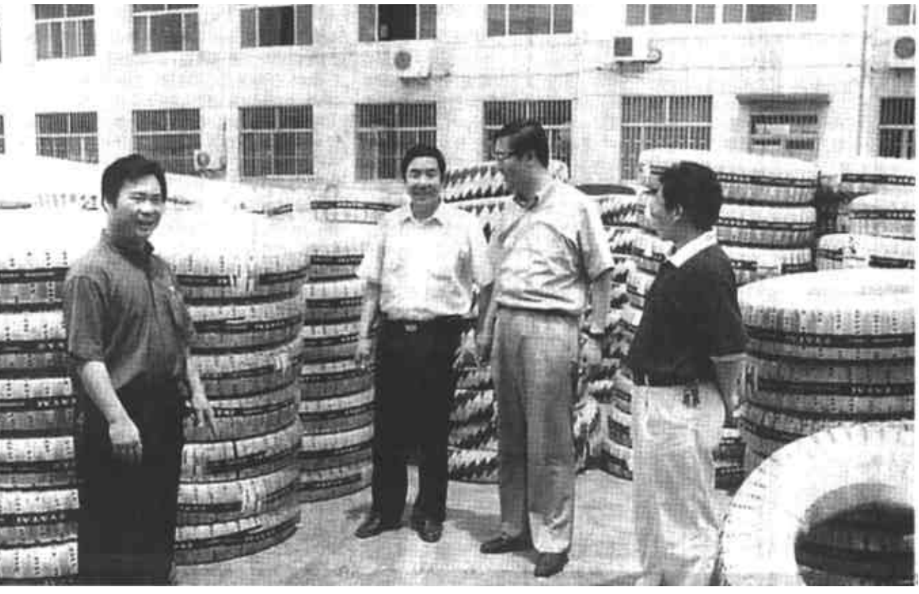
广饶县农村信用社支持民营经济发展作为实施“文明信用工程”的重要内容，不断加大全县民营经济的扶持力度。图为联社的工作人员到西水集团了解情况。

为了让更多的客商来得高兴，留得称心，今年以来，这个村先后制订了外地客商占地盘当年不收费和代为客户办理营业执照以及客商子女的人托入学与本村村民享受同等待遇等一系列服务措施。并作出“如出现本村村民故意干扰客商正常经营的行为，可直接找村两委进行处理，客商当时的一切经济损失全部由村委承担”的承诺。在此基础上，这个村还在今年土地调整时，将靠近公路的20亩耕地留出，作为招商基地。优越的条件、优惠的政策和诚实守信的村风民风，为外来客商创造了良好的投资环境。采访时，一位来自济南搞副食品批发的客商告诉笔者说：“曲家这块招商地，不仅区域环境好，更重要的是这里的人好，他们诚实守信的优良品德很值得我们外来客商学习。”